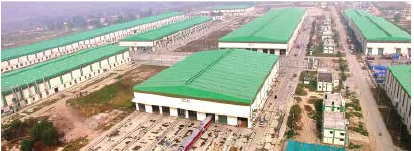
आधुनिक रेलडिब्बा कारखाना, रायबरेली का दृश्य