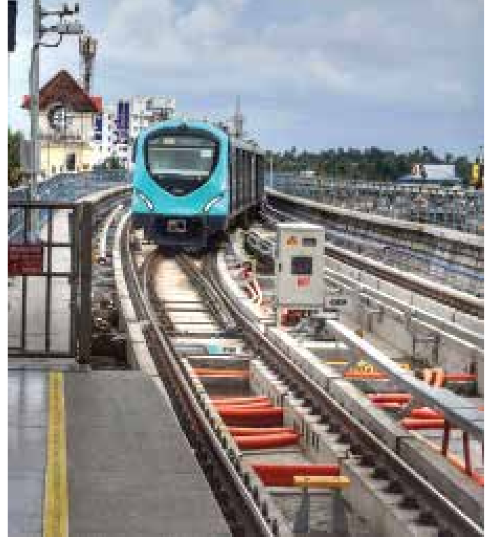
गिट्टीरहित रेलपथ, कोच्ची मेट्रो