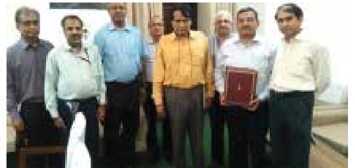
आरएलडीए के साथ समझौता ज्ञान हस्तार करते हुए