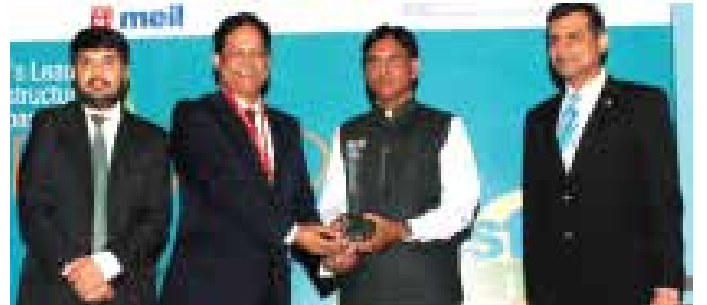
निर्माण व अवसंरचना विकास (रेलवे) में डी एंड बी पुरस्कार, 2016