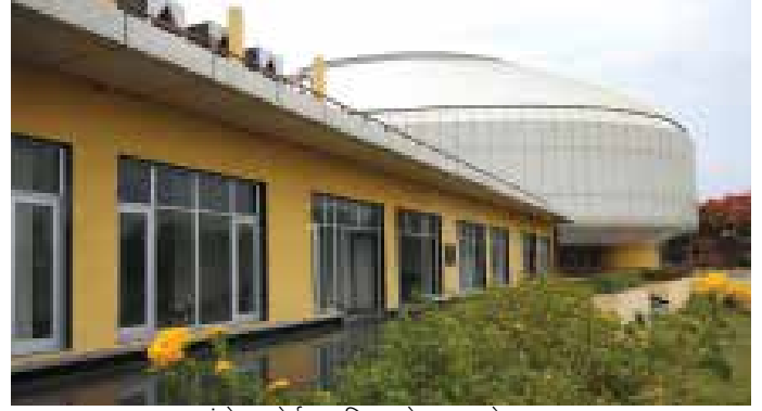
इंडोर स्पोर्ट्स परिसर, बेहाला, कोलकाता