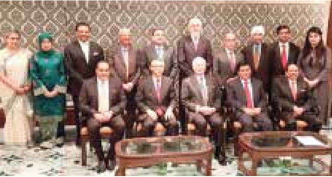
नई दिल्ली में मलेशिया के माननीय प्रधानमंत्री नजीब रजाक की अध्यक्षता में शिष्टमंडल के साथ बैठक

मलेशिया, बांग्लादेश, तंजानिया, श्रीलंका तथा ईरान में ठेके प्राप्त करने के लिए ठोस प्रयास किए जा रहे हैं ।