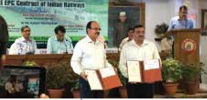
समझौता ज्ञापन पर हस्ताक्षर