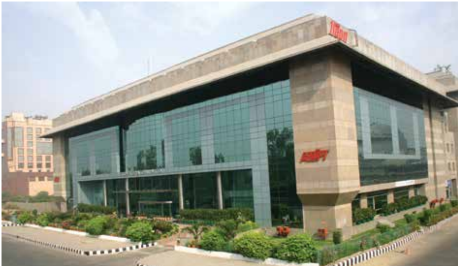
निगमित कार्यालय भवन, इरकॉन, साकेत नई दिल्ली

इंडियन ओवरसीज बैंक भारतीय स्टेट बैंक एचडीएफसी बैंक