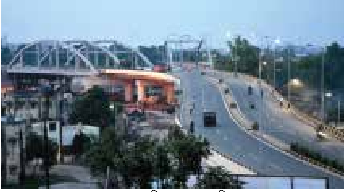
सड़क उपरिपुल, दानापुर, बिहार