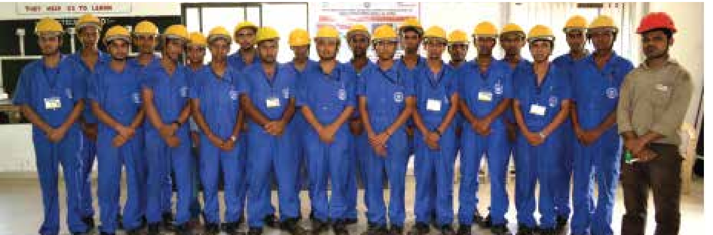
पिछड़े वर्ग के युवाओं के लिए कौशल विकास प्रशिक्षण कार्यक्रम, बिलासपुर (छत्तीसगढ़)

सीएसआर गतिविधियां का क्रियान्वयन विभिन्न सामाजिक क्षेत्रों में सामाजिक विकास को प्राप्त करने के लिए किया जा रहा है जैसे क्षमता निर्माण, समुदायों का सशक्तिकरण, समेकित सामाजिक आर्थिक विकास, हरित और उर्जा कुशल तकनीकों के संवर्धन के माध्यम से पर्यावरण संरक्षण, पिछड़े क्षेत्र के विकास और सीमांत व सुविधाहीन समूहों के उत्थान। आपकी कंपनी स्वास्थ्य, शिक्षा, कौशल विकास, ग्रामीण अवसंरचना विकास, पर्यावरण, स्वच्छता, साफसफाई, तथा सामाजिक आर्थिक विकास के क्षेत्रों में सीएसआर और धारणीय गतिविधियों को निष्पादित कर रही है।