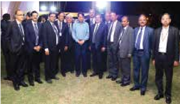
माननीय रेल मंत्री द्वारा आयोजित रेल सहयोग अवसर कार्यक्रम पर वार्ता