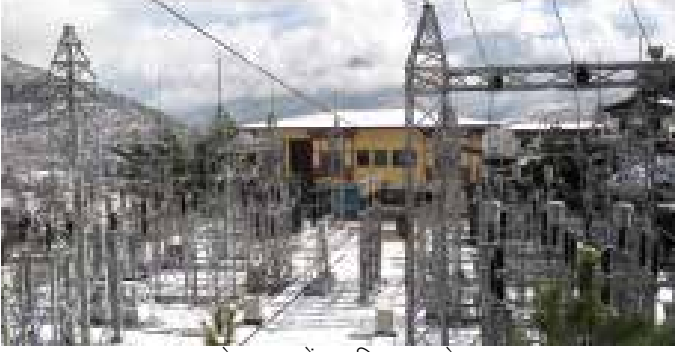
पारो, भूटान में 66 किवा उपस्टेशन