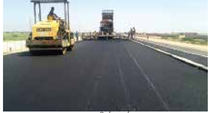
सड़क निर्माण कार्य