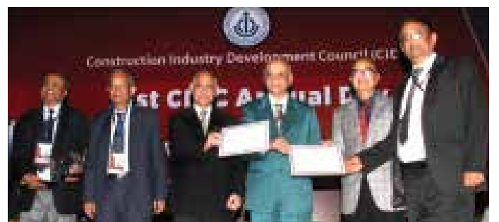
सर्वोत्तम निर्माण परियोजना (रेलवे) में सीआईडीसी विश्वकर्मा पुरस्कार, 2017