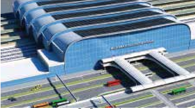
प्रस्तावित बिजवासन स्टेशन