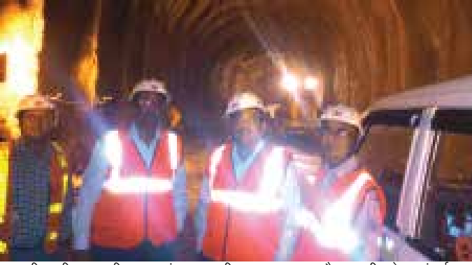
सीएमडी द्वारा टी-49 सुरंग, यूएसबीआरएल, जम्मू और कश्मीर रेल संपर्क परियोजना का निरीक्षण